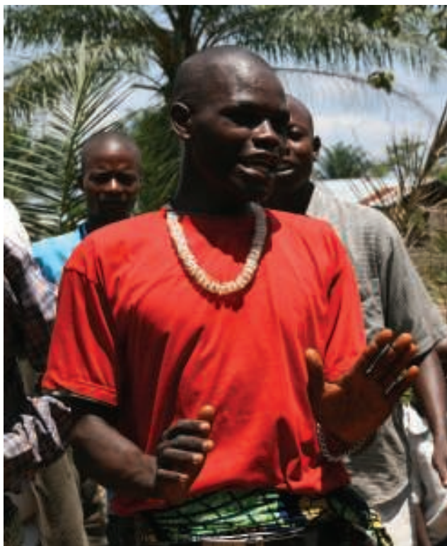
Een zanger op het feest.