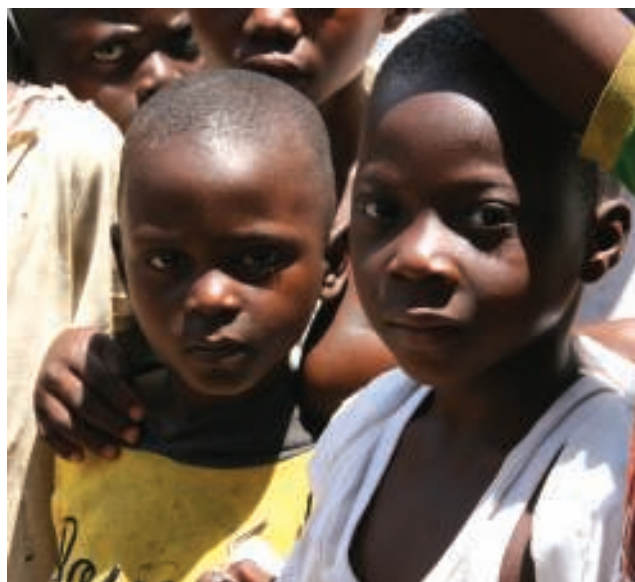
De blanken bekijken op het feest.

Ze werken zeer primitief, deels zelfs met eigenhandig in mekaar gestoken alaam. Ze komen uit de streek van Tshumbe en hebben alleen enkele St. Jozefzagen bij, een schaaf, enkele beitels, een fijne beitelbijl en wat messen. Het hout wordt ter plaatse geleverd: planken van verschillende diktes en kwaliteiten. Uit die planken zagen ze dan wat ze nodig hebben: