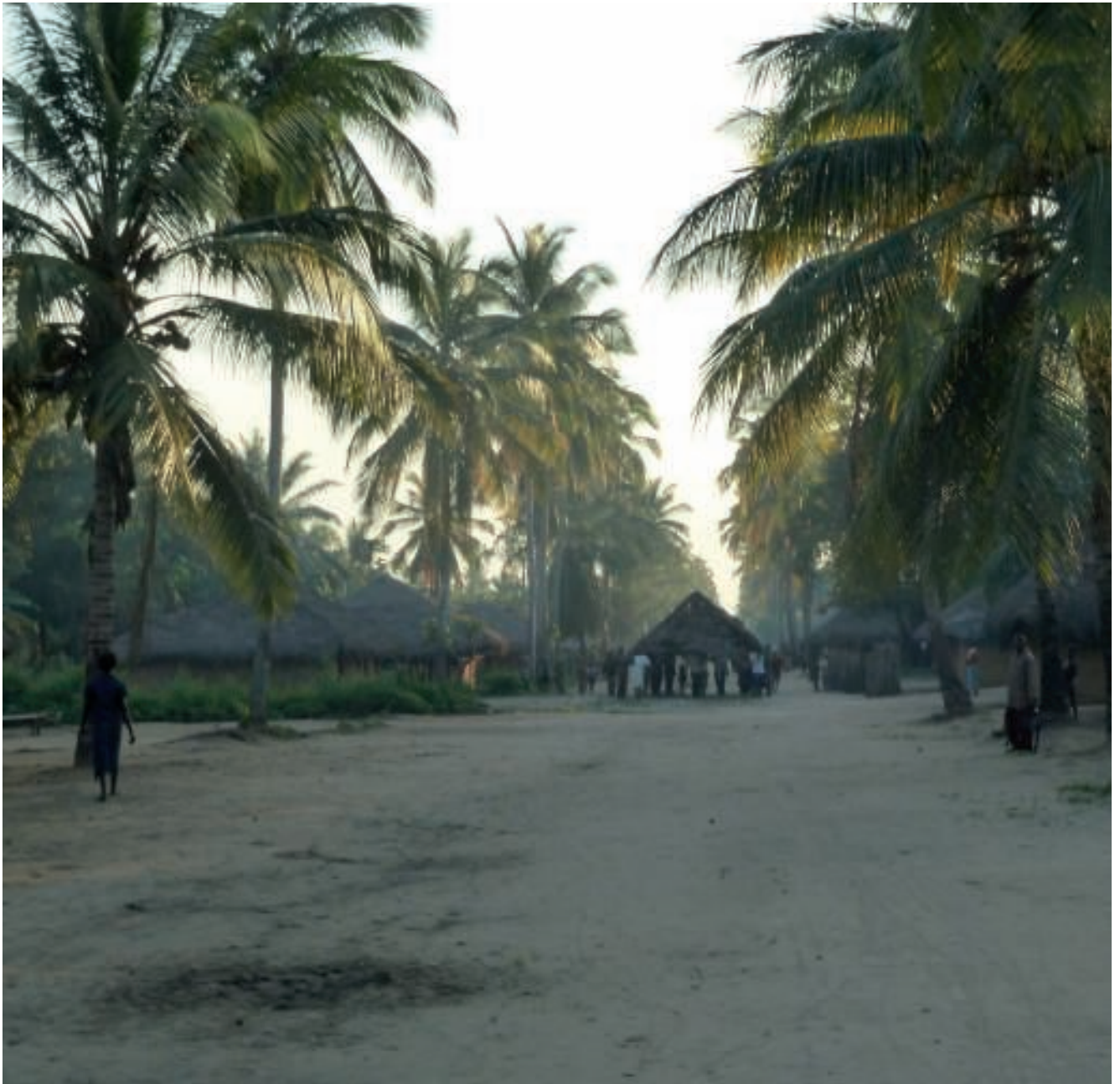
Op wandel met het dak.