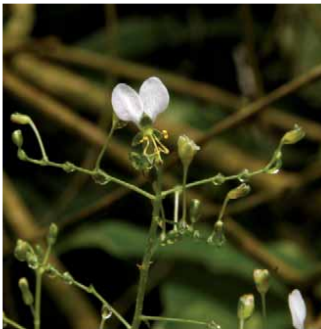
mooi bloempje in het Evenaarswoud

Wat een afwisseling aan kleuren, bomen- en plantensoorten (epifytische varens, soortenrijke onderbegroeiing, nooit geziene aantallen bomen- planten- en bloemensoorten). De verschillende soorten determineren is al rijdend een bijna onmogelijke klus. Varens zijn relatief gemakkelijk te herkennen, vooral de hertshoornvarens. Ik had gehoopt af en toe wat orchideeën te zien. Die zijn echter niet in bloei en dan is het moeilijk om ze te spotten. Toch meen ik ergens hangend aan een tak een Calyptrichium christianum -plant te herkennen. Die orchideeën groeien altijd hangend, ze zijn tot twee, drie