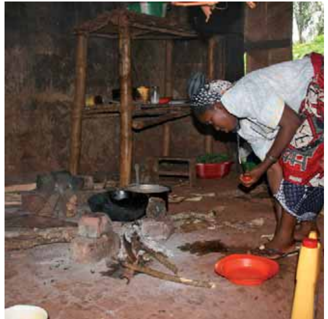
koken in Kiomi

Het is ondertussen laat geworden. Tijd om onder de douche te gaan én voor de zeep-watertest. De zwarte vettigheid laat zich zonder