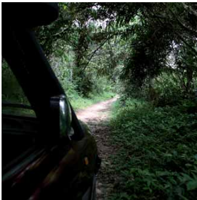
het smalle pad in de brousse

Om een veld aan te leggen in het woud krijgen de inwoners van de 'chef' een stuk woud toegewezen. Het onderhoud wordt gekapt en afgebrand en de grote bomen worden 'geringd' zodat ze één na één sterven en na verloop van tijd omvallen. De goede bomen (tropisch hardhout) worden tot planken verzaagd. Op die veldjes telen de vrouwen hoofdzakelijk rijst, maniok en maïs. Je kan ervan op aan: die rijst is van uitstekende kwaliteit, grove korrel, heel lekker van smaak. Ik spreek/schrijf van ondervinding. Maar geregeld wordt de rijstooft door een insectenplaag geteisterd. De oogst mislukt dan en er heerst hongersnood. Dit jaar is dat het geval in de streek rond Tshumbe en twee jaar geleden in het gebied waar we nu voorbijrijden. De ondervoeding doodt heel wat kinderen die geen weerstand meer kunnen bieden aan eenvoudige infectieziekten.