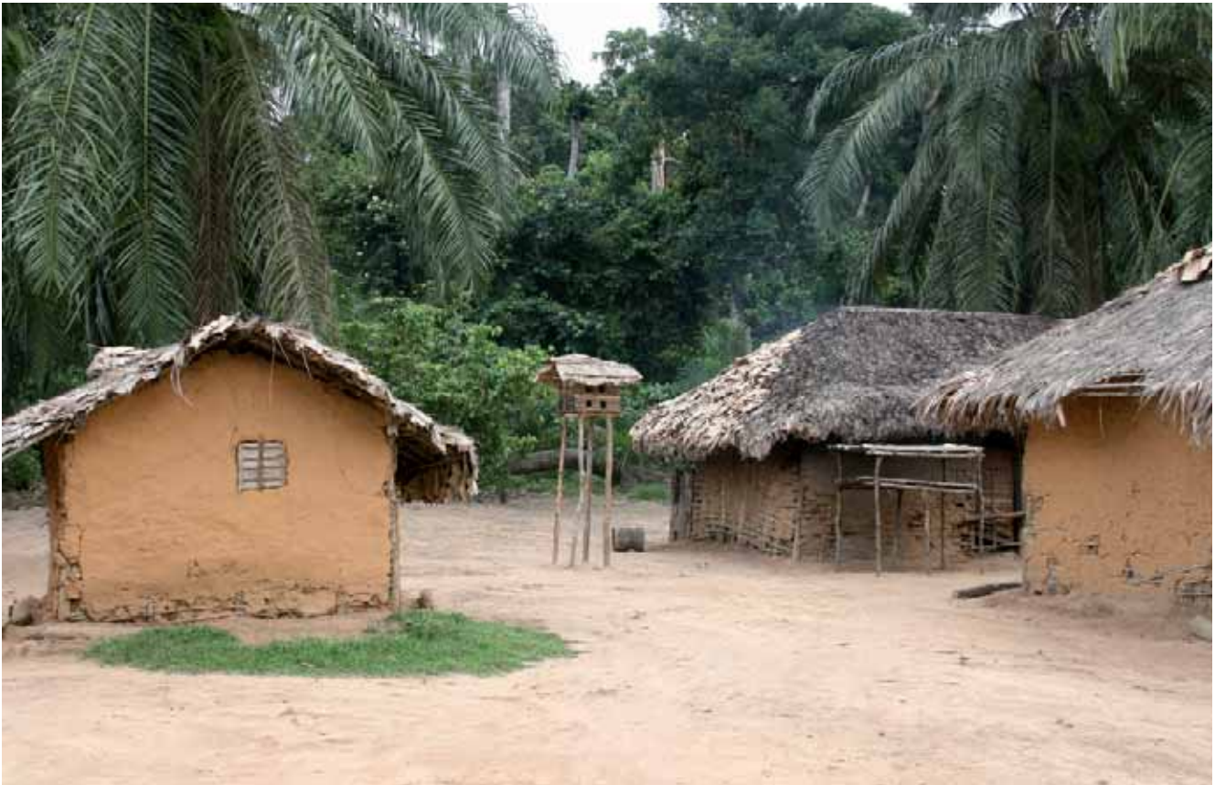
een duiventil centraal tussen enkele hutten

mand van ons westerlingen zou hier ook maar één nacht zoals de bewoners willen overnachten, denk ik. Het is een zeer arme streek waar de inwoners in middeleeuwse omstandigheden leven. Ze wonen in lemen hutten met bladerdak.