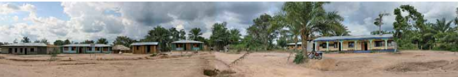
de campus van het ziekenhuis te Katako-Kombe, panoramafoto