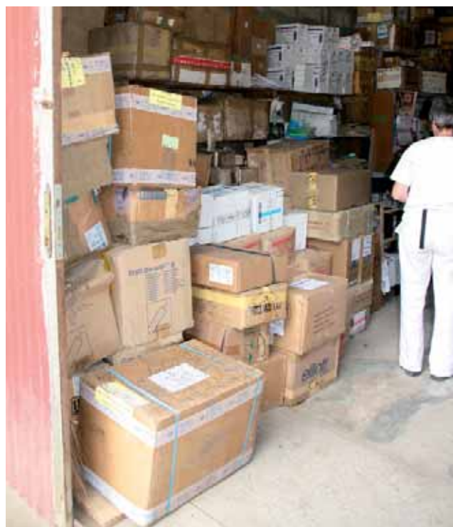
1000 kilogram materialen om te sorteren

doos tenzij wat verpakkingsmateriaal. In een andere doos vinden we toch nog enkele stukken. Het lijkt er erg op dat die ene doos dus ergens geopend werd. Dit betekent dat, als de AzV maandag toekomen zonder operatiekits, er een serieus probleem is. De AzV zullen dan amper kunnen werken. We testen ook de solarlampen uit die met gelden van het Steyaertfonds aangekocht zijn. Ze zullen aan het ziekenhuis en aan de best functionerende centres en postes de santé geschonken worden. Die lampen zijn een prachtig werktuig. Overdag laadt een batterij zich op met zonne-energie (zonnepaneeltje), 's nachts kan een sterke LED-lamp, bij bijvoorbeeld bevallingen, haar nut bewijzen en kaarsen of petroleumlampen vervangen.