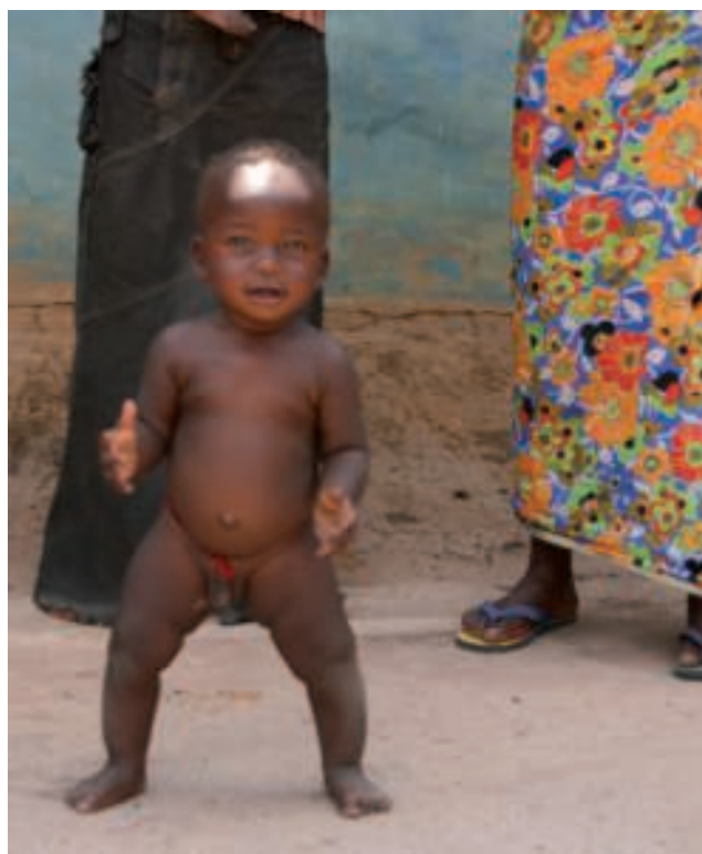
In Lotola, de eerste pasjes.