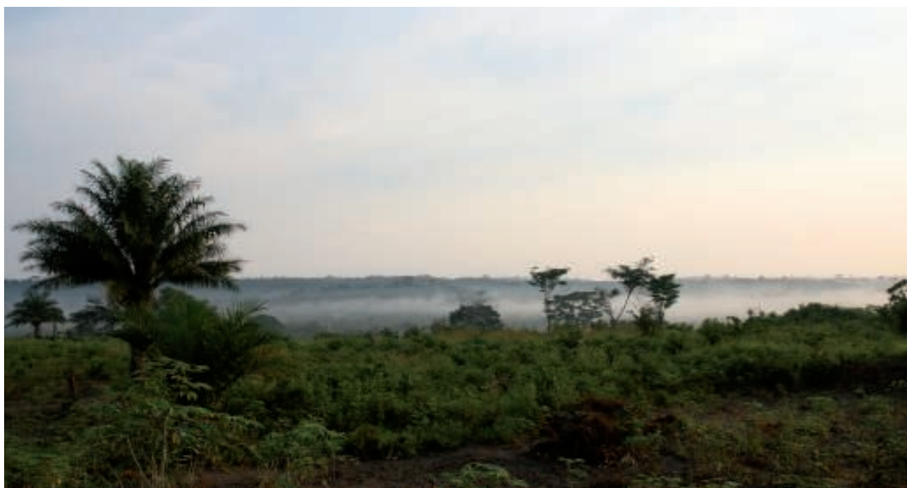
Om zes uur 's morgens achter het bisschoppelijk paleis.