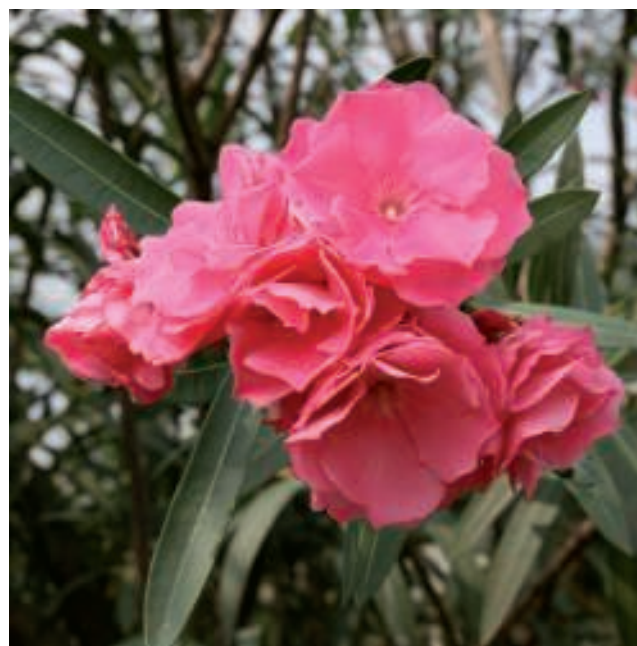
Oleander in de tuin van de Kapucijnen.