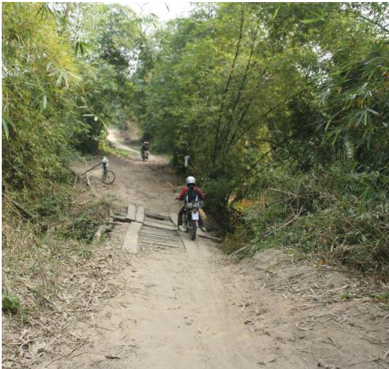
Een brug onderweg in het woud. Zelfs om daar met de motor over te rijden is voorzichtigheid geboden.