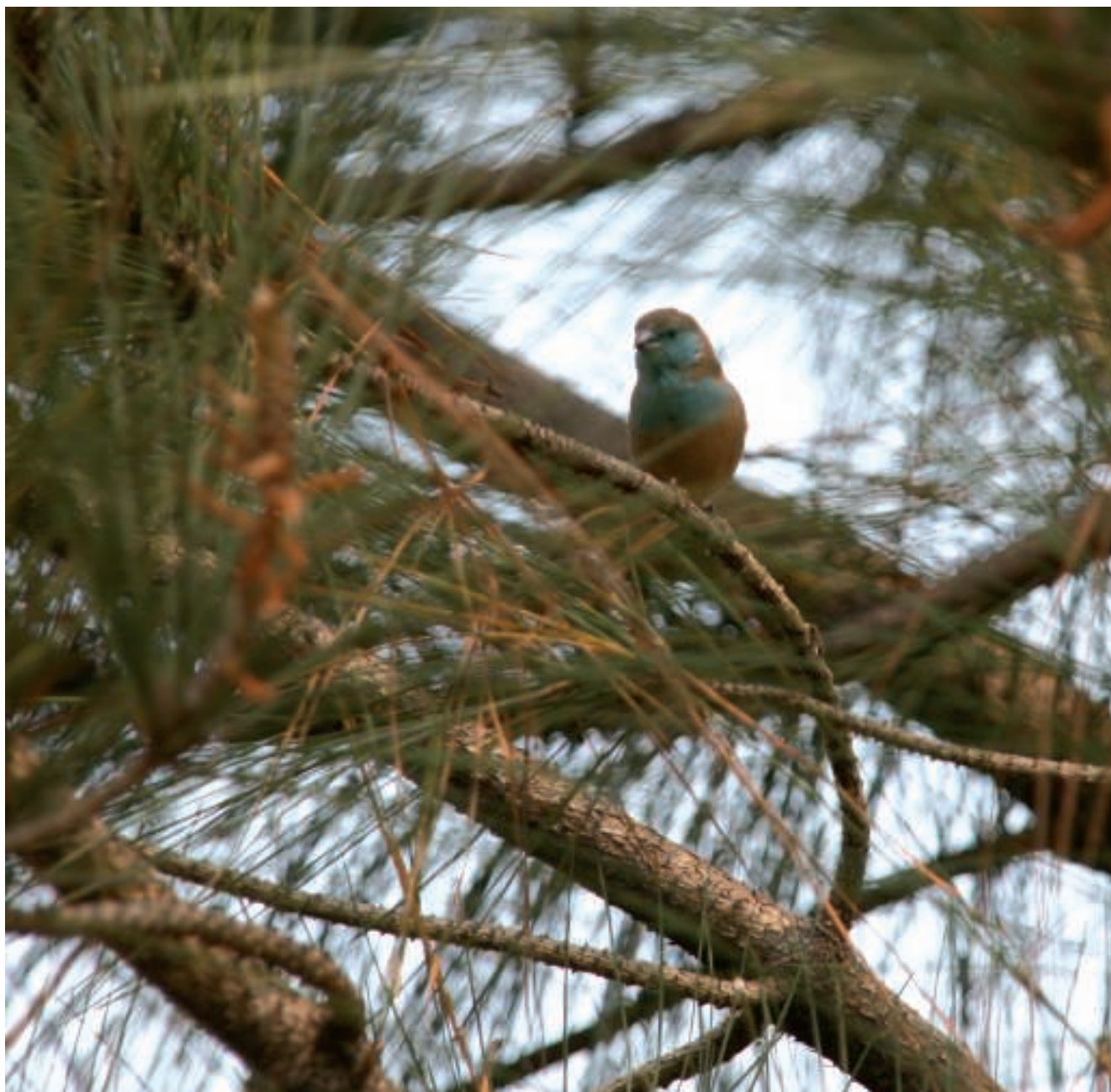
Congolees vinkje in de tuin van de Kapucijnen.