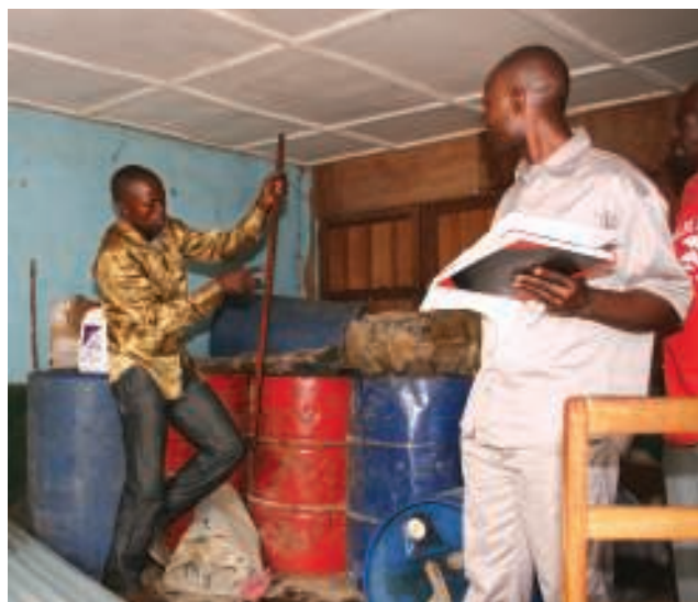
De hoeveelheid brandstof in elk vat wordt opgemeten.

Op de middag komt de jonge vroedvrouw van de kleine materniteit van Shinga II langs. Yves heeft een lang en interessant gesprek met