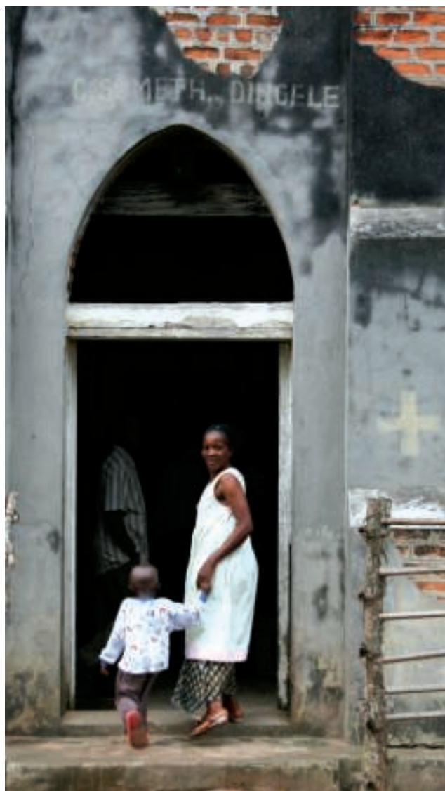
Ingang bouwvallige 'Centre de Santé' van Dinglele.

Als we weer willen vertrekken, komt iemand met een vers gekapte tros bananen aangelopen: een bedankje voor ons bezoek (dat van mij aan het centre?). De avond valt als we thuiskomen.