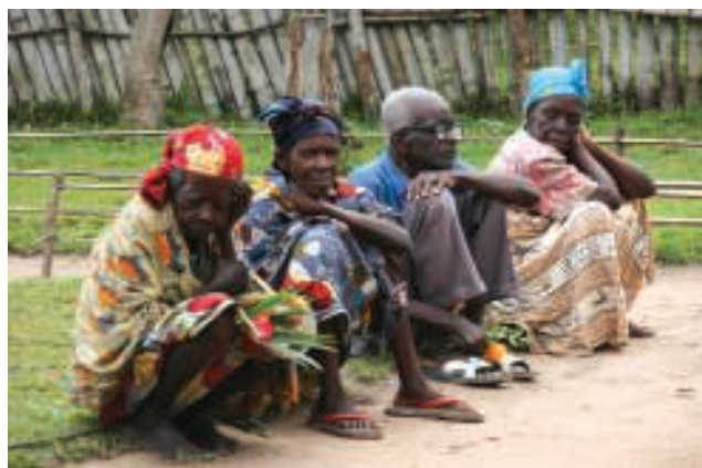
Straks komt 'docteur Yvè' met wat handgeld.

Met King bekijk ik de betonnen tafel in het lokaal dat het nieuwe labo zal worden. Afgrijselijk is die tafel. Bovenop is een chap-