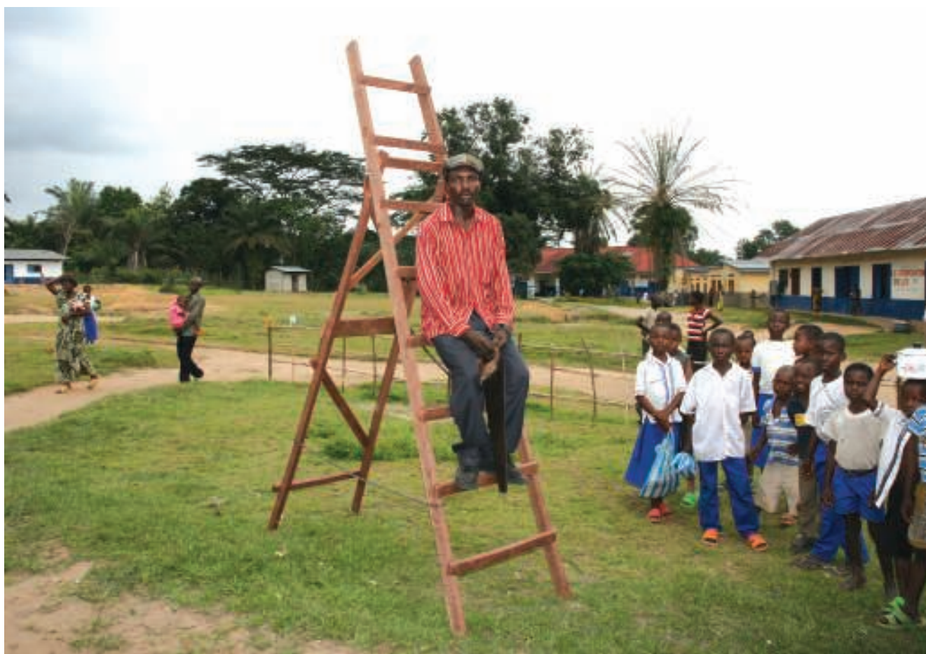
De chef van de schrijnwerkers op onze nieuwe ladder.